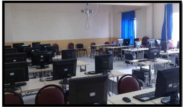
Şekil 3. Derslik ve laboratuvarlarımız