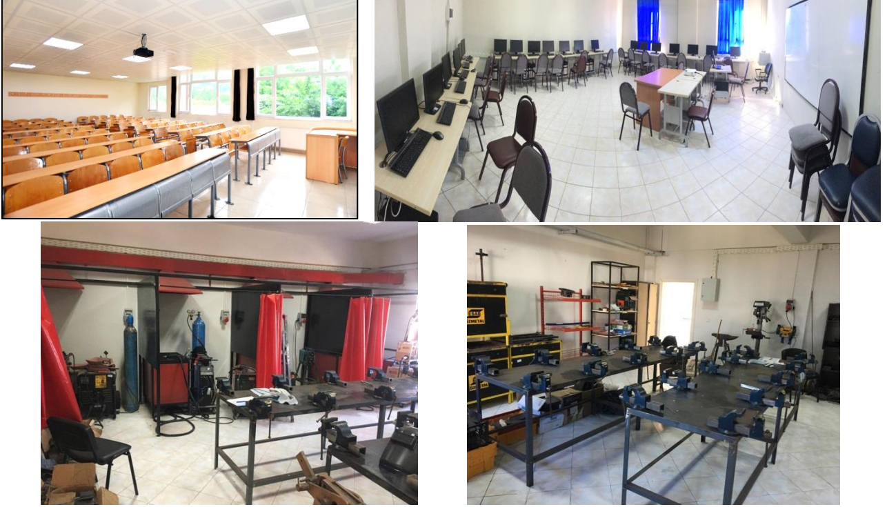
Şekil 2. Derslik ve laboratuvarlarımız

Okulumuzda 9 derslik, 3 adet bilgisayar laboratuvarı ve 1 adet kaynak laboratuvarı vardır.