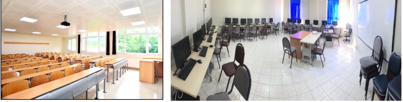
Şekil 2. Derslik ve laboratuvarlarımız

Okulumuzda 9 derslik, 3 adet bilgisayar laboratuvarı ve 1 adet kaynak laboratuvarı vardır.