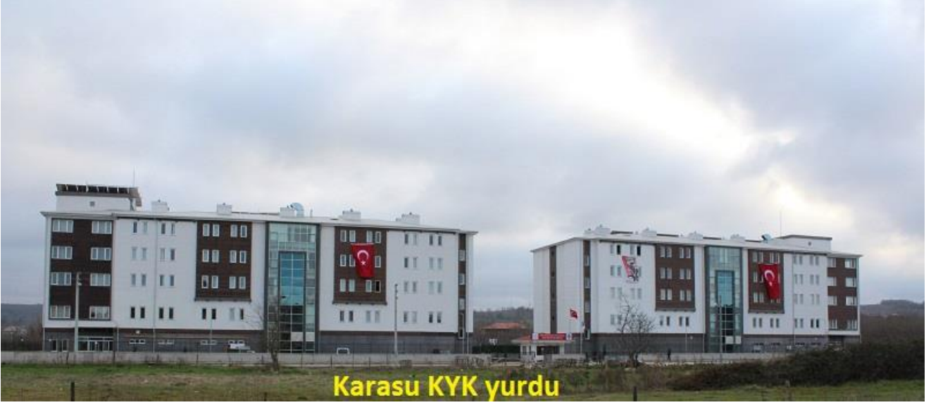
Şekil 2. KYK Yurtları