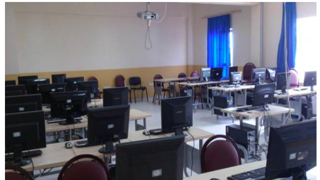
Şekil 3. Derslik ve laboratuvarlarımız