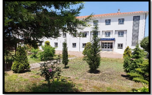
Şekil 1. MYO Yerleşkemiz