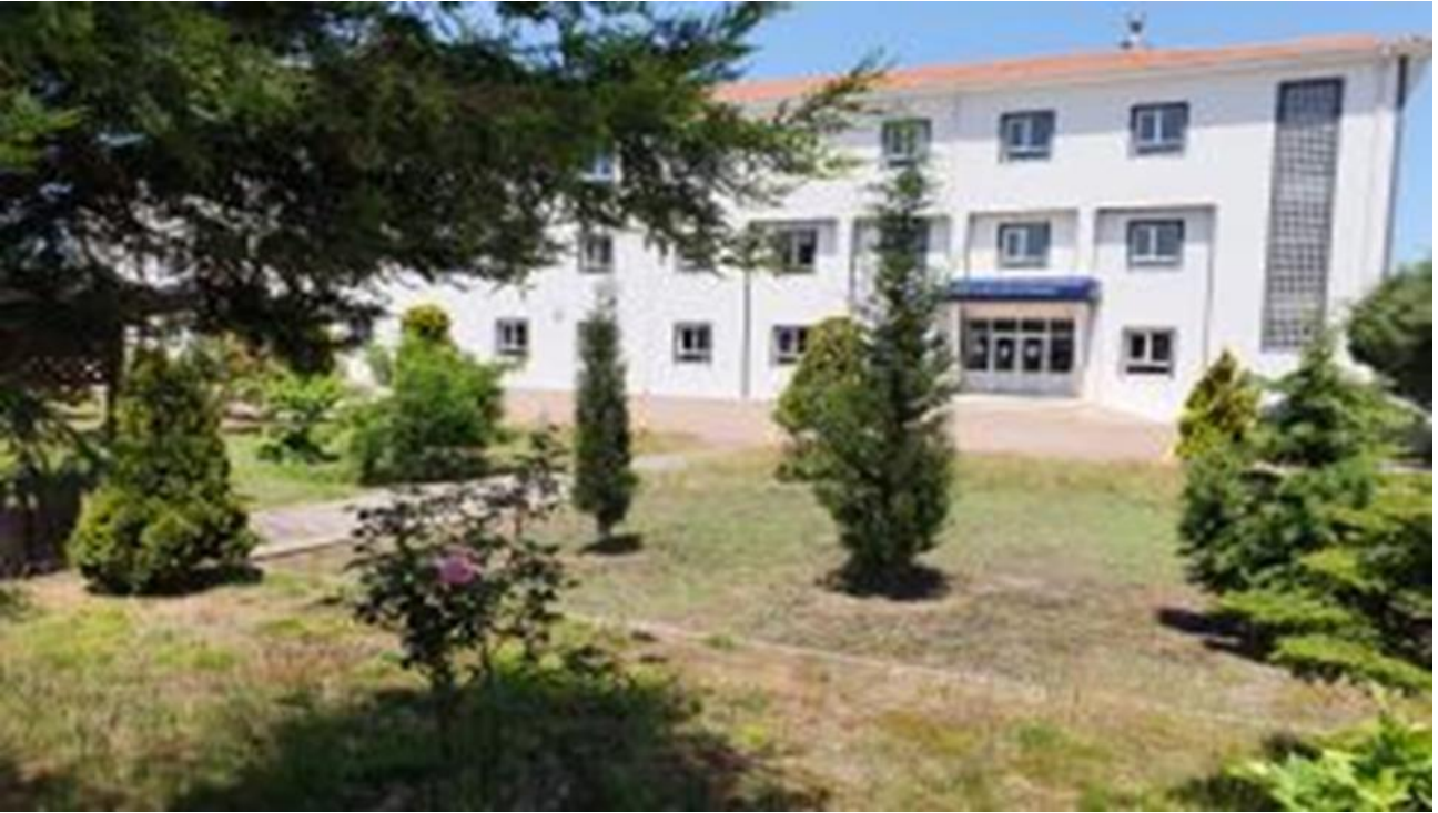
Şekil 1. MYO Yerleşkemiz

Mesleki eğitim-öğretimde hedeflediği yüksek kalite standartlarıyla mezunlarına uygulama becerisi kazandırma yetkinliği ile ulusal ve uluslararası düzeyde adından söz ettiren; iş dünyası ile iş birliği içinde geleceğin nitelikli işgücü ihtiyacını karşılamaya yönelik etkili çözümler üreten, takım çalışmasını teşvik eden, demokratik, şeffaf, iletişime ve değişime açık bireyler yetiştirmek amacımızdır.