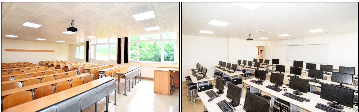
Şekil 3. Derslik ve laboratuvarlarımız