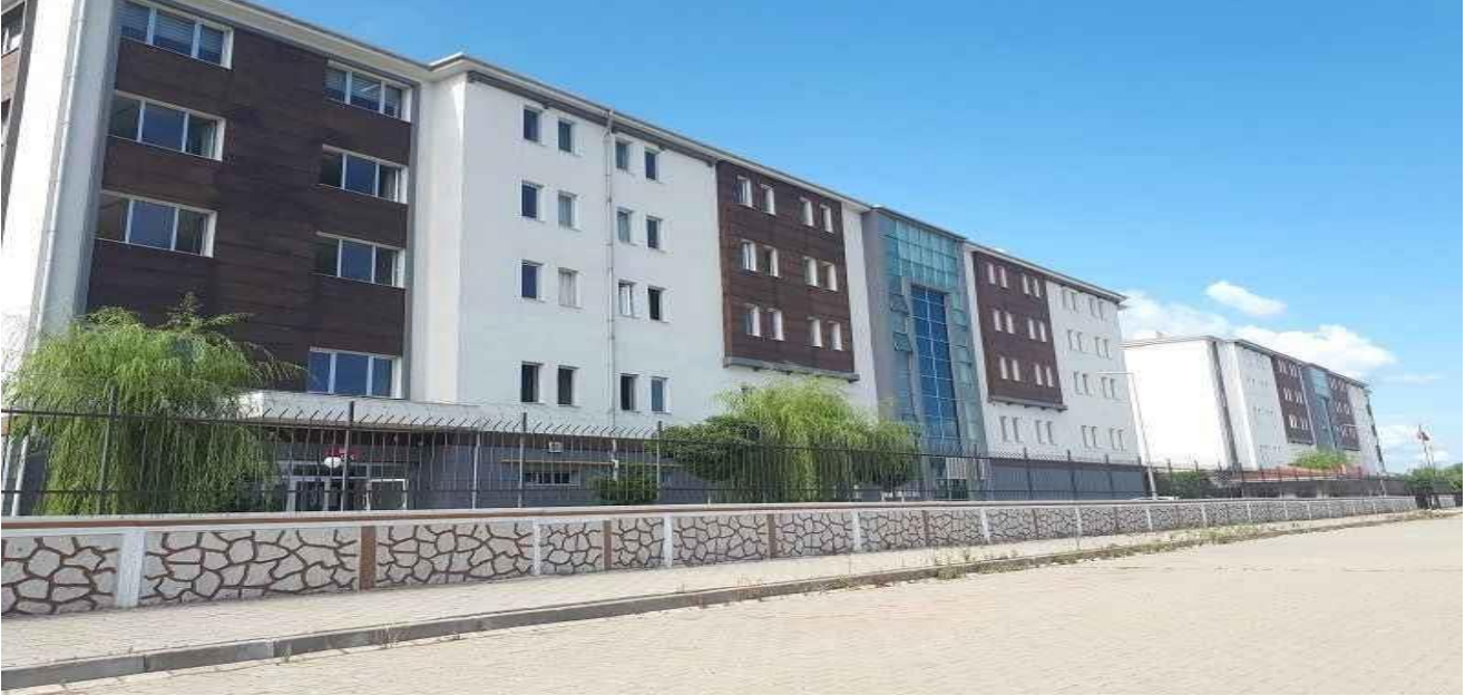
Şekil 2. Okulumuz ve KYK Yurtları

Karasu Meslek Yüksekokulu; gölü, yemyeşil doğası ve doğu- batı, kuzey-güney Ulaşım imkânlarıyla (İstanbul-Ankara) ulusal ve uluslararası taşımacılıkta önemli yeri olan D-100 Karayolu, TEM Otoyolu ve Kuzey Marmara Karayolundan konumuyla İstanbul'a 1,5 saat, Ankara'ya 3,5 saat mesafededir. Karasu Meslek Yüksekokulu Yerleşkesine iki yüz metre mesafede Kredi Yurtlar Kurumu'nun (KYK) 300 kişilik öğrenci yurdu bulunmaktadır.